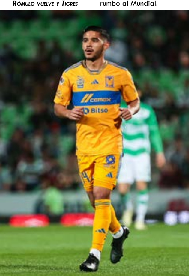
RÓMULO VUELVE Y TIGRES