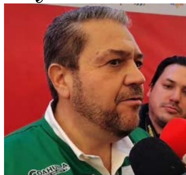
Indicó que, en coordinación con la Secretaría de

Asimismo, señaló que el Ayuntamiento ha brindado atención a parte de las personas despedidas de General Motors, con el objetivo de canalizarlas hacia otras oportunidades laborales, ya que la bolsa de trabajo municipal cuenta con vacantes disponibles en diversas empresas de la región.