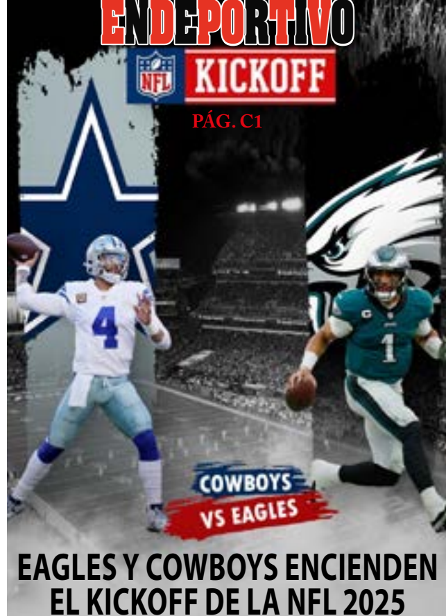
EAGLES Y COWBOYS ENCIENDEN EL KICKOFF DE LA NFL 2025