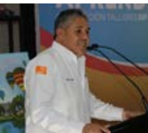
CRISTINA FLORES / FACTOR

Hasta el momento, los equipos de emergencia continúan trabajando intensamente para sofocar el incendio, el cual ha afectado una porción significativa del área de la serranía del rancho las Hayas.