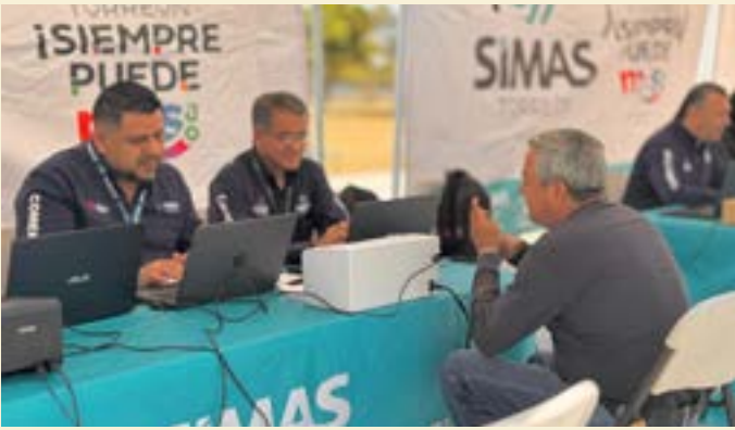
table y drenaje sanitario.

En horario de 9 de la mañana a 2 de la tarde, personal de la Paramunicipal estará atendiendo a usuarios del sector para que realicen sus pagos, ajustes en sus adeudos, contratos, así como la recepción de sus reportes relacionados con los servicios de agua po-