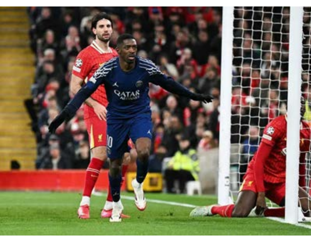
DONNARUMMA Y ALISSON, FIGURAS BAJO LOS TRES PALOS

FACTOR LIVERPOOL, REINO UNIDO.- El París Saint-Germain logró la gran sorpresa en Anfield al eliminar al Liverpool en los octavos de final de la UEFA Champions League. Con un triunfo 1-0 en el tiempo regular y la prórroga, igualó el marcador global (1-1) y se impuso 4-1 en la tanda de penales, asegurando su boleto a la siguiente ronda del torneo continental.