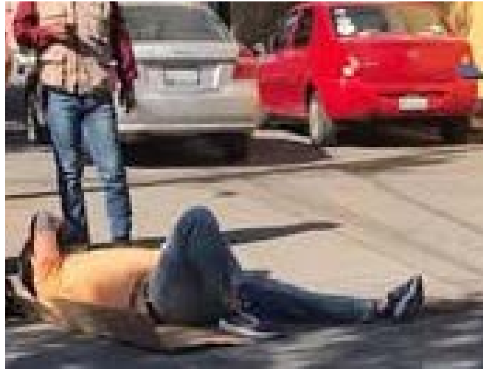
por paramédicos de bomberos contundido y fue trasladado en ambulancia a un hospital local