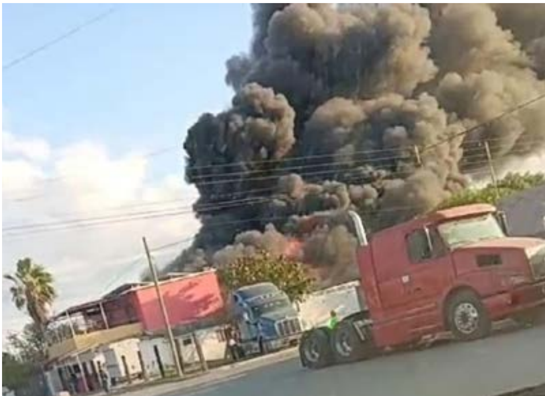
En este incendio una mujer salió intoxicada siendo tras-

Un corto circuito provocó que se incendiara una vivienda en el barrio dos en la calle Cuauhtémoc con numeral 17 y fueron los vecinos quienes alertaron a los cuerpos de emergencia por una llamada telefónica.